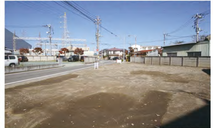
▲【3】敷地内、南側より撮影。間口は約29mあり車の出入りも楽々です