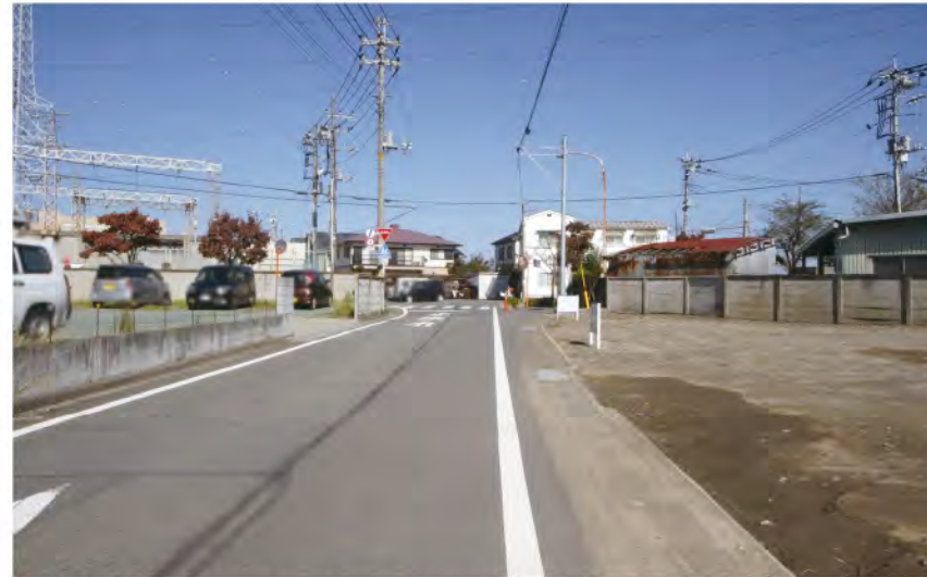
▲【2】北西側道路は約5.9mと車のすれ違いもスムーズです