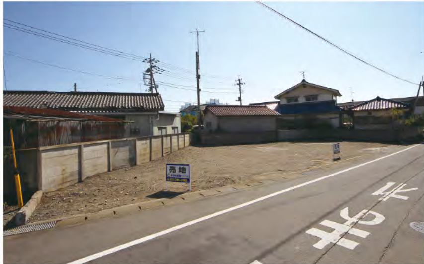
▲【1】北西側より撮影。南北に長い形の敷地で日中も陽当たり良好です

上水道・下水道・都市ガス引込済み、境界確定済み、建築条件なく、お好きなメーカー・工務店で建築可能。 県道藤岡大胡線まで約70m、国道17号線まで約800mと、藤岡市・玉村町・上里町・本庄市へもアクセス良好。 関越道「上里スマートIC」まで約3700m、上信越道「藤岡IC」まで約5800mと車での家族旅行やお出かけもスムーズに。