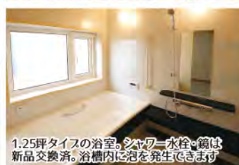
1.25坪タイプの浴室。シャワー水栓、鏡は新品交換済。浴槽内に泡を発生できます