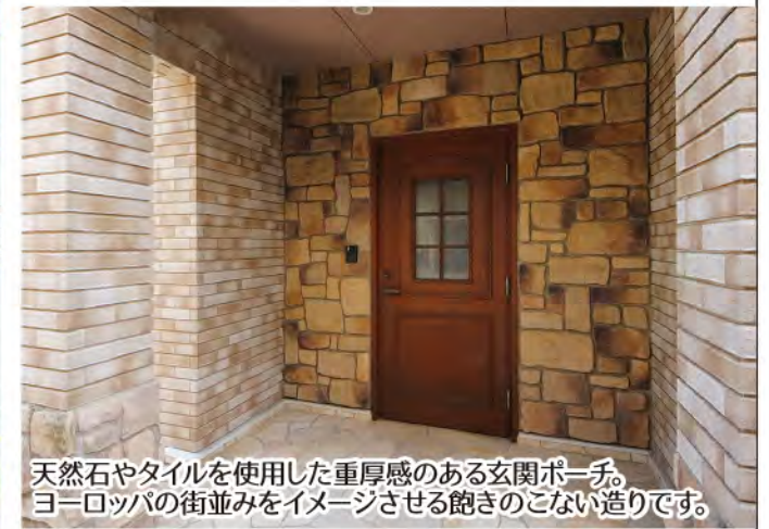
天然石やタイルを使用した重厚感のある玄関ポーチ。ヨーロッパの街並みをイメージさせる飽きのこない造りです。