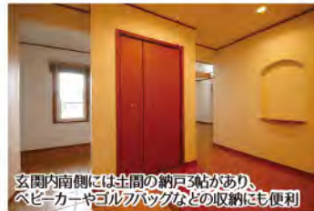
玄関南側には洗面の納戸3帖があり、ベビーカーやゴルフバッグなどの収納にも便利