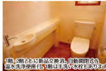
1階・2階ともに新品交換済。自動開閉式&温水洗浄便座付。1階は手洗い水栓もありです