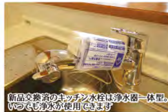
新品交換済のキッチン水栓は浄水器一体型。いつでも浄水が使用できます