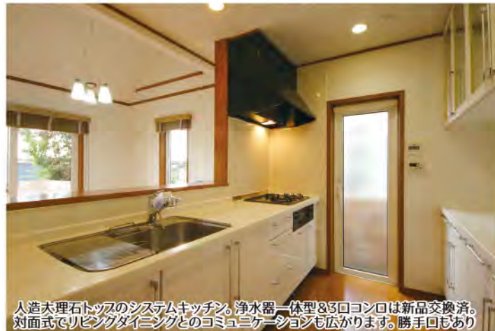
人造大理石トップのシステムキッチン。浄水器一体型&3口コンロは新品交換済。対面式でリビングダイニングとのコミュニケーションも広がります。勝手口もあり