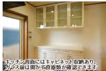
キッチン背面にはキャビネット収納あり。ガラス扉は開かず食器類が確認できます