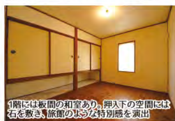
1階には板間の和室あり。押入下の空間には石を敷き、旅館のような特別感を演出