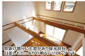
吹抜け部分にも窓があり採光良好。日差しもたっぷりの明るいリビングです