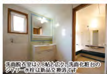
洗面脱衣室は2.8帖と広々。洗面化粧台のシャワー水栓は新品交換済です