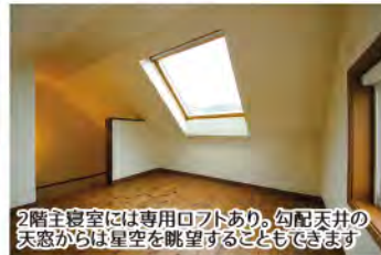
2階主寝室には専用ロフトあり。勾配天井の天窓からは星空を眺望することもできます