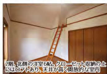
2階、北側の洋室6帖。クローゼット収納の上にはロフトあり、天井が高く開放的な室内