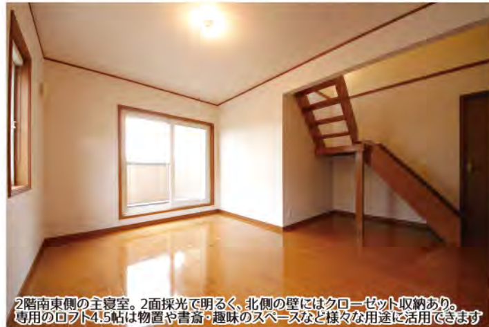
2階南東側の主寝室。2面採光で明るく、北側の壁にはクローゼット収納あり。専用のロフト4.5帖は物置や書斎、趣味のスペースなど様々な用途に活用できます