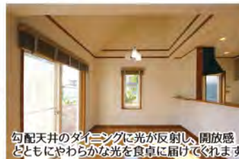
勾配天井のダイニングに光が反射し、開放感とともにやわらかな光を食卓に届けてくれます