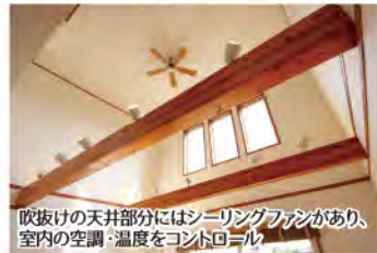
吹抜けの天井部分にはシーリングファンがあり、室内の空調・温度をコントロール