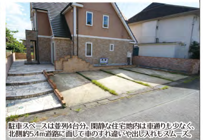
駐車スペースは並列4台分。閑静な住宅地内は車通りも少なく、北側約5.4m道路に面して車のすれ違いや出し入れもスムーズ。

※給付には収入等その他条件がございます条件により給付が受けられない場合がございます