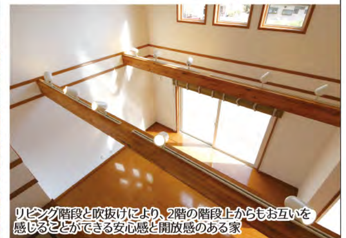
リビング階段と吹抜けにより、2階の階段上からもお互いを感じることができる安心感と開放感のある家