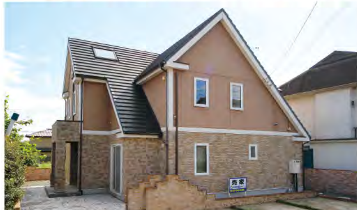
天然石やレンガを多数使用したヨーロピアンテイスト溢れる外観と外構により、重厚感あふれるのこないアンティーク調の家。内外装リフォーム済で新品設備も多数。