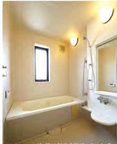
シャワーヘッド・鏡は新品交換済。オートバスでいつでもあたたかなお風呂に入れます