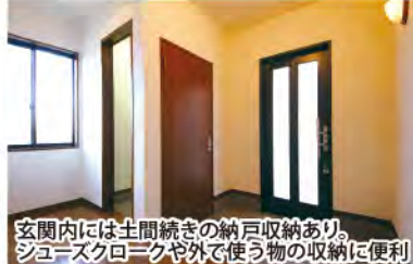
玄関内には土間続きの納戸収納あり。シューズクロークや外で使う物の収納に便利