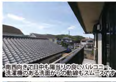
南西向きで日中も陽当りの良いバルコニー。洗濯機のある洗面からの動線もスムーズです