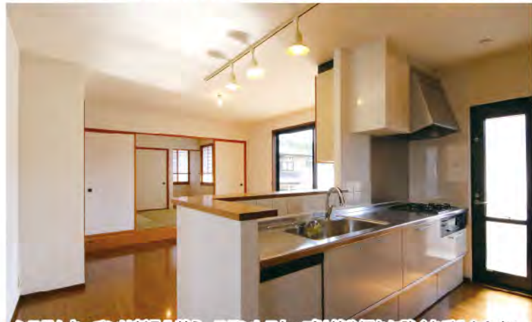
システムキッチンは新品入替え。ステンレストップは錆や汚れに強くお手入れも楽々。リビングの様子も見渡せる対面式キッチンでコミュニケーションも広がります