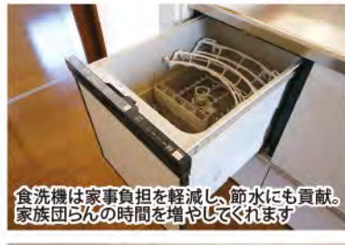
食洗機は家事負担を軽減し、節水にも貢献。家族団らんの時間を増やしてくれます