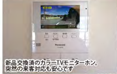
新品交換済のカラーTVモニターホン。突然の来客対応も安心です