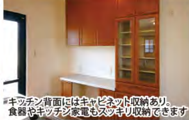
キッチン背面にはキャビネット収納あり。食器やキッチン家電もスッキリ収納できます