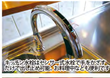
キッチン水栓はセンサー式水栓で手をかざすだけで出し止め可能。お料理中なども便利です