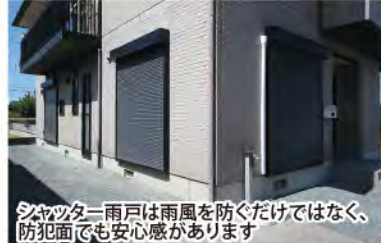
シャッター雨戸は雨風を防ぐだけでなく、防犯面でも安心感があります