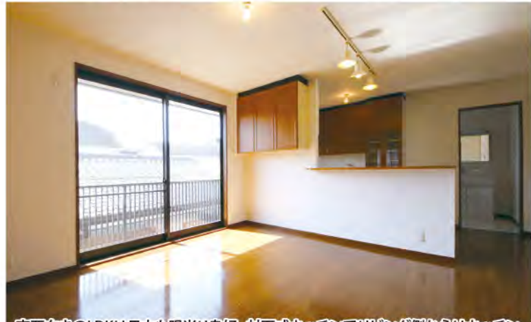
南西向きLDKは日中も陽当り良好。対面式キッチンでリビング側からはキッチンが見えず、突然の来客時など、動線からもキッチンが見られることはありません