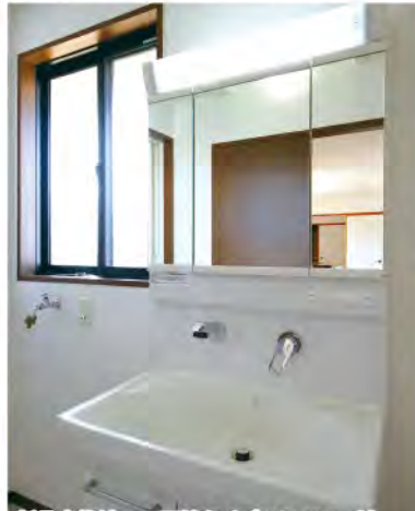
新品交換済の三面鏡タイプのシャワー付洗面化粧台。洗髪やボウルの掃除にも便利