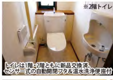
※2階トイレ トイレは1階・2階ともに新品交換済。センサー式の自動開閉フタ&温水洗浄便座付