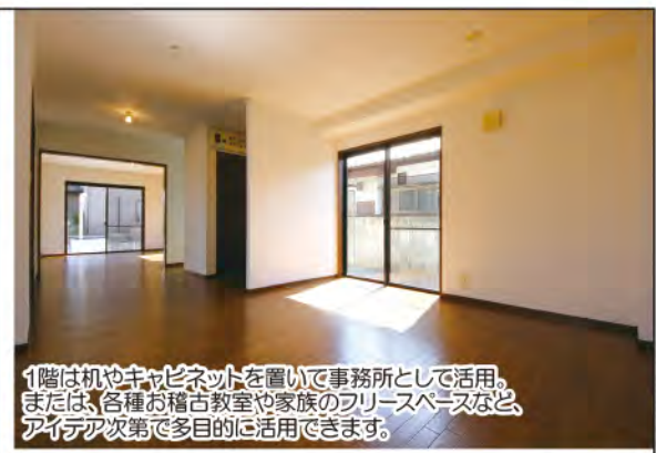
1階は机やキャビネットを置いて事務所として活用。 または、各種お稽古教室や家族のフリースペースなど、 アイデア次第で多目的に活用できます。