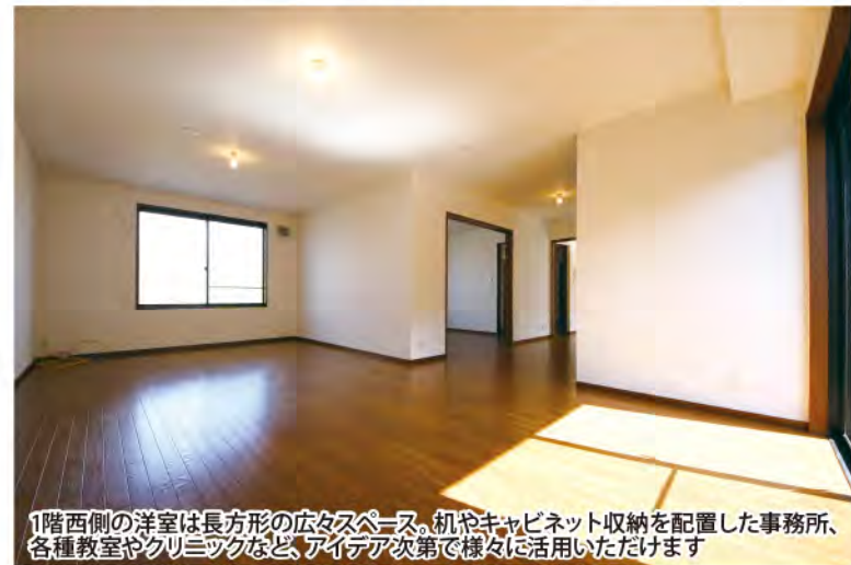
1階西側の洋室は長方形の広々スペース。机やキャビネット収納を配置した事務所、各種教室やクリニックなど、アイデア次第で様々な活用いただけます