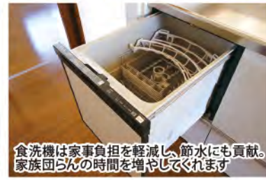
食洗機は家事負担を軽減し、節水にも貢献。家族団らんの時間を増やしてくれます