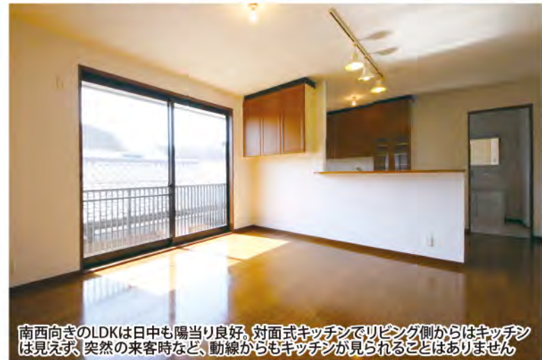
南西向きのLDKは日中も陽当り良好。対面式キッチンでリビング側からはキッチンが見えず、突然の来客時など、動線からもキッチンが見られることはありません