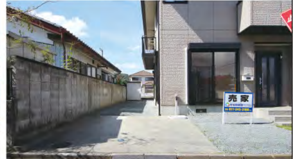
駐車スペースは建物東側に並列2台分駐車可能(車種による)。 前面道路は6.2mあり、車の出し入れもスムーズに行えます。