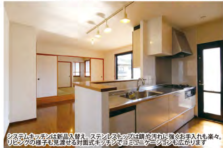
システムキッチンは新品入替え。ステンレストップは錆や汚れに強くお手入れも楽々。リビングの様子も見渡せる対面式キッチンでコミュニケーションも広がります