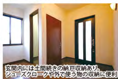
玄関内には土間続きの納戸収納あり。ジュースクローゼットや外で使う物の収納に便利