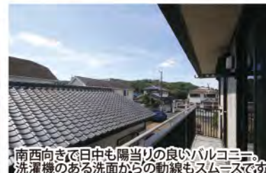
南西向きで日中も陽当りの良いバルコニー。洗濯機のある洗面からの動線もスムーズです