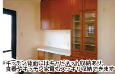
キッチン背面にはキャビネット収納あり。食器やキッチン家電もスッキリ収納できます