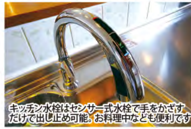
キッチン水栓はセンサー式水栓で手をかざすだけで出し止め可能。お料理中なども便利です