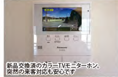
新品交換済のカラーTVモニターホン。突然の来客対応も安心です