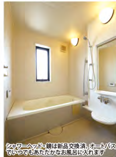
シャワーヘッド・鏡は新品交換済。オートバスいつでもあたたかなお風呂に入れます