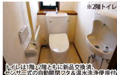
※2階トイレ トイレは1階・2階ともに新品交換済。センサー式の自動開閉フタ&温水洗浄便座付