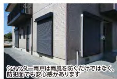
シャッター雨戸は雨風を防ぐだけでなく、防犯面でも安心感があります