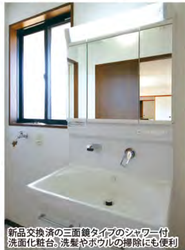
新品交換済の三面鏡タイプのシャワー付洗面化粧台。洗髪やボウルの掃除にも便利