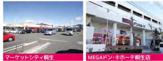
マーケットシティ桐生