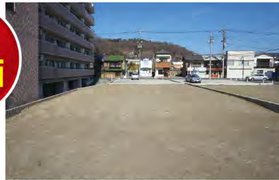
▲【区画3】南側道路の間口は約13.8m