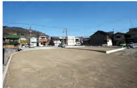
▲【区画3】南側約4.5m道路面。建築後舗装致します