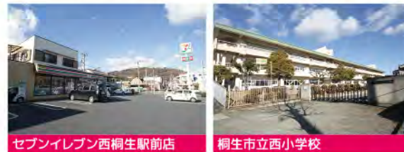
セブンイレブン西桐生駅前店