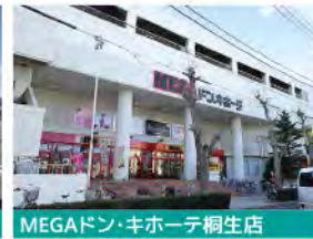
MEGAドン・キホーテ桐生店