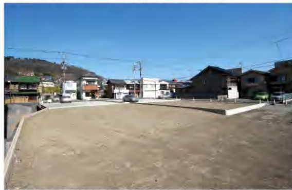
▲【区画3】南側約4.5m道路面。建築後舗装致します