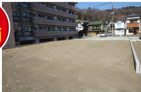
▲【区画3】南側道路面の間口は約13.8m