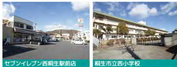
セブンイレブン西桐生駅前店