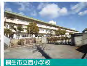
桐生市立西小学校