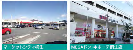
マーケットシティ桐生