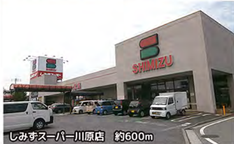
しみずスーパー川原店 約600m

小学校・保育園・公園も近くにあり、お子様の通学や送り迎えなど、子育て環境も良好。 コンビニ・スーパー・ドラッグストアは徒歩8分圏にあり、日々の買い物も便利。 国道17号線や上毛大橋も近く、前橋市中心市街地や吉岡町・渋川市へのアクセスも良好。