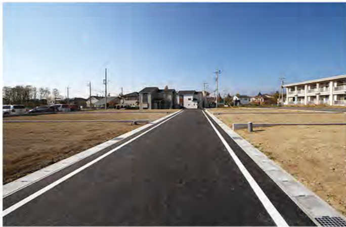
分譲地内6.0m道路。西詰で所有者以外の一般車両が入ることも少ないです

■ 閑静な住宅地内にあり、商業施設や教育施設、公園も近く利便性の高い立地 です。