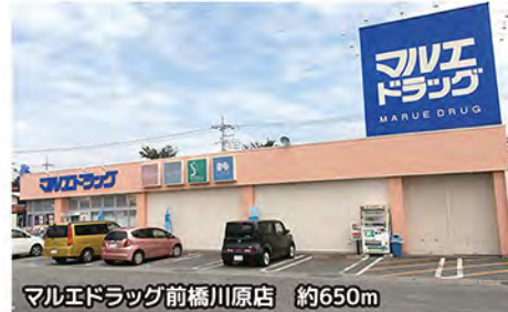
マルエドラッグ前橋川原店 約650m