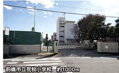
前橋市立荒牧小学校 約1000m