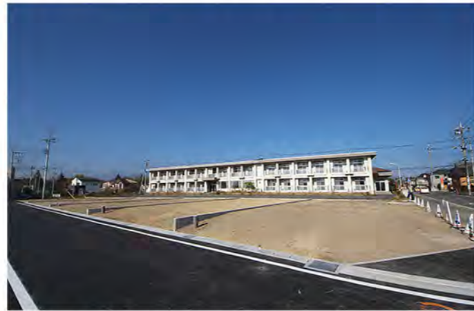
分譲地内、北側の5区画は南道路で陽当たり良好