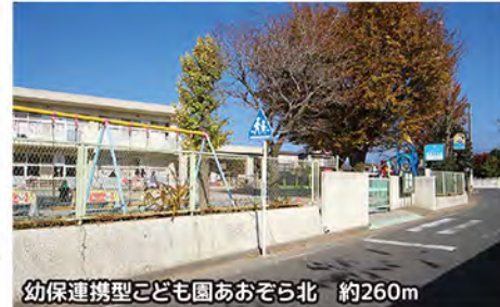
幼保連携型こども園あおぞら北 約260m